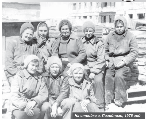
На стройке г. Погодного, 1976 год

Уважаемые мои земляки – бывшие строители, штукатуры-маляры, плотники, сварщики, электрики, работники ЖБИ и все, кто был причастен к возведению нашего уже родного пос. Усть-Камчатска!